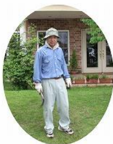
会社の裏の竹林から切り出した竹でフラワーボックスを作ってみました