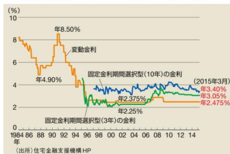
民間金融機関の住宅ローン金利推移(変動金利等)

(注)※転職した場合、年収が下がった場合 ※健康状態が悪い場合 ※住宅ローンや他のローン(カード利用、携帯電話など)に延滞がある場合 など、借り換えができない場合があります