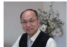
写真・文: 小笠原和人