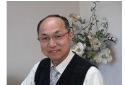
写真・文：小笠原和人