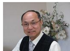
写真・文：小笠原和人